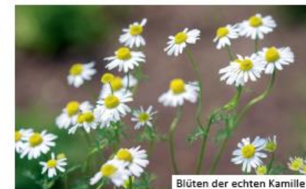
Blüten der echten Kamille

gebietsfremdes Kanadisches Berufkraut ( Erigeron canadensis ) oder heimisches Scharfes Berufkraut ( Erigeron acris ): beide haben jedoch kürzere Blütenblätter verschiedene Kamillen (Hundskamillen, Echte Kamille, Strandkamille): breite und weniger zahlreiche Blütenblätter sowie geteilte Blätter