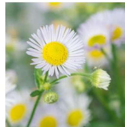
Blüte (Juni bis Oktober) viele Körbchenblüten, jede Blüte mit vielen sehr schmalen (0.5 mm), weissen bis lila Blütenblättern und gelben Staubblättern