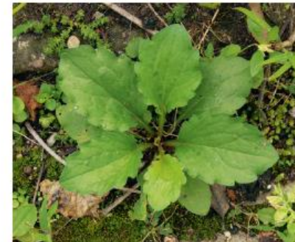
Jungpflanze bodennahe Rosette im ersten Jahr

ein-, zwei- oder bei Schnitt mehrjährige, bis 120 cm hohe krautige Pflanze, aufrechter, oben meist verzweigter, behaarter Stängel, bildet auf offenen Flächen dichte Bestände